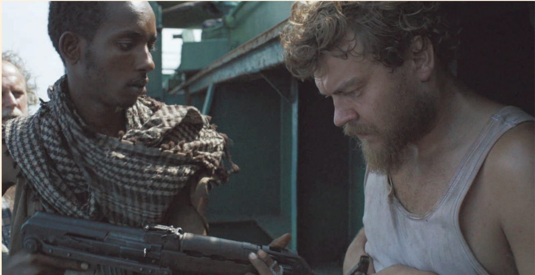
In de Deense film 'Kapringen' spelen naast de acteur Pilou Asbæk ook heel wat mensen mee die ooit een gijzeling hebben meegemaakt.

- Sommige regels uit de de-ontologische code bieden onvoldoende houvast . 'Is een meisje dat op zaterdagavond dood wordt gereden omdat ze zonder licht reed (...) maatschappelijk relevant genoeg om haar foto in de krant te zetten? Dat leert die regel mij niet.' - Gebrek aan deontologische opleiding en bijscholing. 'Als we een perskaart heb-ben voor een zekere verant-woordelijkheid tegenover staat, waarom dan niet in ruil voor die perskaart drie dagen opleiding volgen?' - Collega's die buiten de lijn-tjes kleuren, worden zelden echt bestraft . - Ook voor ons is dit werk emotioneel erg belastend . - Onder druk van bovenaf en van concurrenten worden vaak grenzen verlegd. Eind-redacties willen sensationele titels en foto's. 'Het bloed moet van de pagina's lopen (...) Dan zijn ze content!' - We vrezen dat bij een volgende ramp opnieuw fouten gemaakt worden.